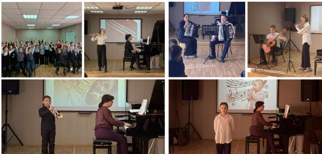
17.04.2023г. Концерт-лекция «С любовью к Родине» С.В. Рахманинов