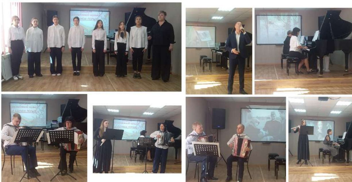
04.03.2023г. Концерт «Февромарт»