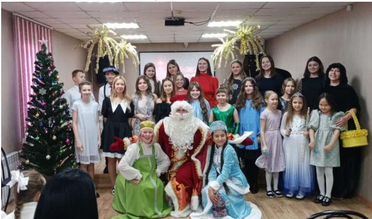
Рп. Лесогорск 27.12.2023г.