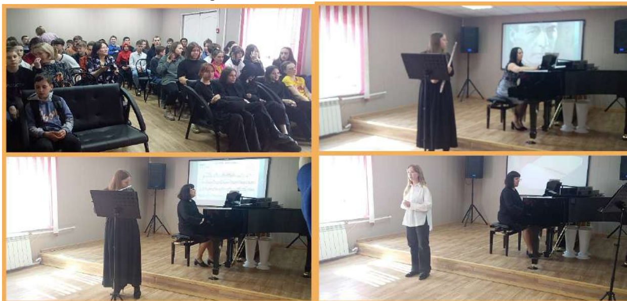
20.04.2023г. Концертная программа для воспитанников ГОКУ «Специальная» (коррекционная) школа» рп. Лесогорск